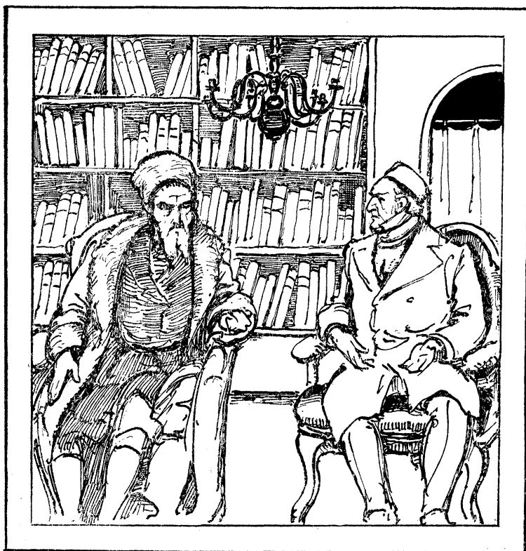
מאַנטעפּיאַרע אין קאַוונע, ביי רב יצחק אלחנן